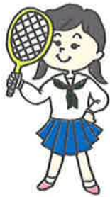
〇〇さん(中学2年生) テニス部に入って 中学生生活を奮闘中